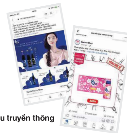
Tư liệu truyền thông